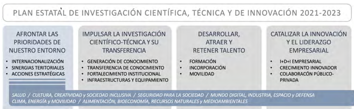
Gráfico 1: Estructura del PEICTI 2021-2023.

Acciones Estratégicas con el objetivo de cohesionar las políticas sectoriales en I+D+I, sino que guían, de manera implícita, la visión estratégica y el enfoque temático de todos los Programas y Subprogramas Estatales.