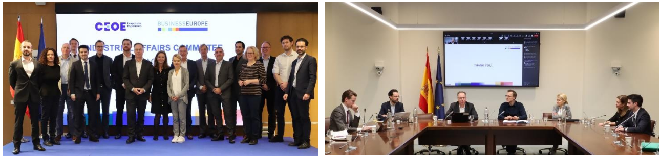
Momentos durante la reunión Comité de Asuntos Industriales de BusinessEurope en la sede de CEOE en Madrid. (09-10/11/23).