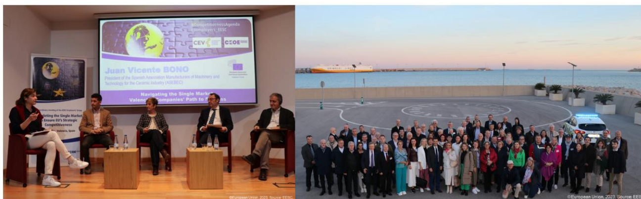
Conferencia sobre competitividad y mercado único del Grupo I CESE, en la sede de la CEV, y foto grupal durante la visita al puerto de Valencia del Grupo I Empresarios del CESE. (27-28/11/23)

Los miembros del Grupo I visitaron también el puerto de Valencia y la iniciativa Marina de Empresas así como algunas de las start-ups que forman parte de esta.