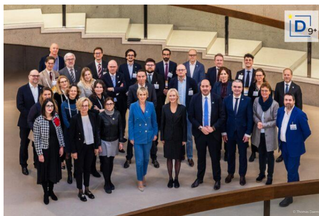
Foto grupal de los participantes en el evento de B9+ en Bruselas, entre ellos la secretaria de Estado de Digitalización e Inteligencia Artificial, Carme Artigas, y representantes de CEOE.

En el marco del grupo ministerial informal D9+ , y siguiendo la estela de las últimas cumbres celebradas en Las Palmas (16/12/22) y Poznan (11/05/23), Bruselas fue en diciembre el escenario de la conferencia de alto nivel y del encuentro bilateral entre el D9+ y el B9+ , con representación de CEOE.