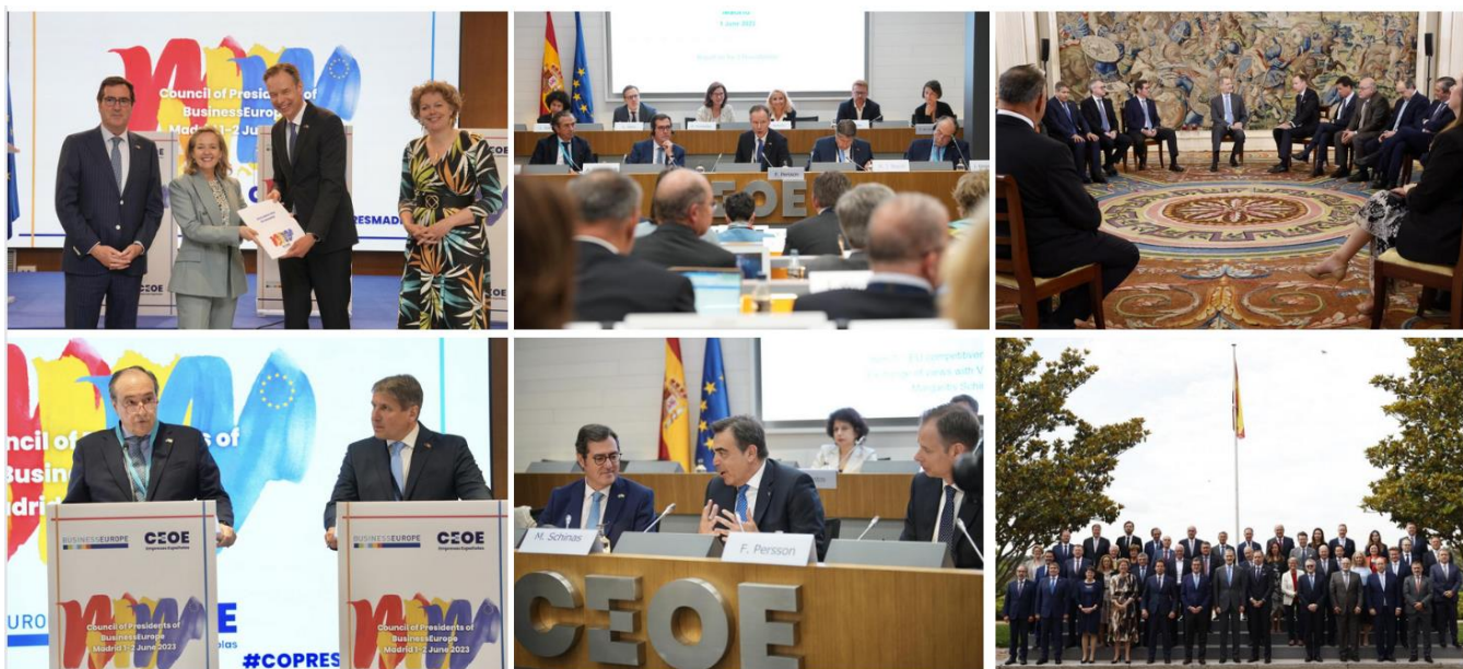
Momentos durante el COPRES de Madrid (01-02/06/23).

El documento se presentó en la sede de CEOE en Madrid a la vicepresidenta primera del Gobierno y ministra de Asuntos Económicos, Nadia Calviño, y al vicepresidente de la Comisión Europea, Margaritis Schinas, y en una audiencia con Su Majestad el Rey en el Palacio de La Zarzuela.