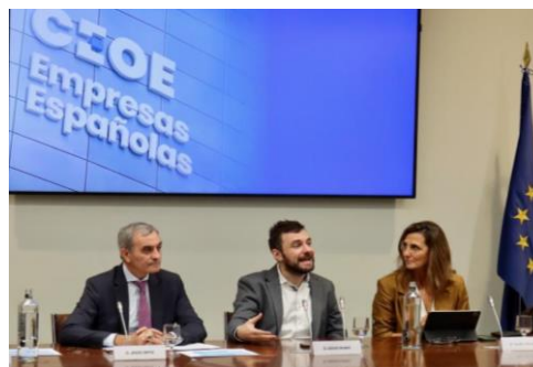
Intervención de Diego Rubio, director de la Oficina Nacional de Prospectiva y Estrategia, junto a los presidentes de las Comisiones de UE y Relaciones Internacionales de CEOE. (17/10/23).

El tema principal de la reunión fue el análisis y seguimiento de los resultados del Consejo Europeo (EUCO) informal de Granada relativos a la autonomía estratégica abierta y la próxima agenda estratégica de la UE, partiendo del documento Resilient EU2030 que fue presentado por el gobierno días antes del EUCO en CEOE.