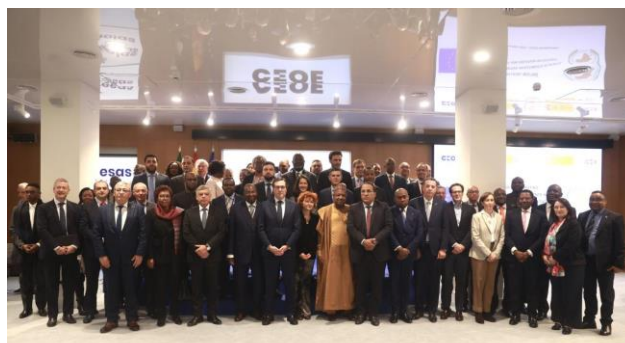
Autoridades y representantes empresariales y en el Encuentro empresarial UE-África celebrado en la sede de CEOE, en Madrid. (19/12/23).