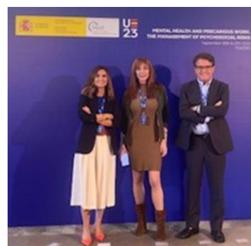
Representantes de CEOE en el evento sobre salud mental y precariedad laboral celebrado en Toledo

El acto reunió a representantes de los Estados miembros, el Parlamento y la Comisión Europea, interlocutores sociales y organismos especializados en seguridad y salud en el trabajo, tanto a nivel europeo, como nacionales. Durante el mismo se debatió sobre la salud mental y los riesgos psicosociales, como una de las grandes prioridades en el ámbito de la seguridad y salud en el trabajo.