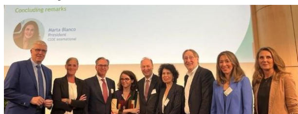
Participantes del evento sobre la agenda comercial de la UE (24/05/23).

CEOE y sus homólogas sueco (SN), cuya Presidencia del Consejo estaba finalizando, y belga (FEB), cuya presidencia seguía a la española, organizaron este evento en Bruselas para subrayar la necesidad de una política comercial europea abierta, moderna y equilibrada.