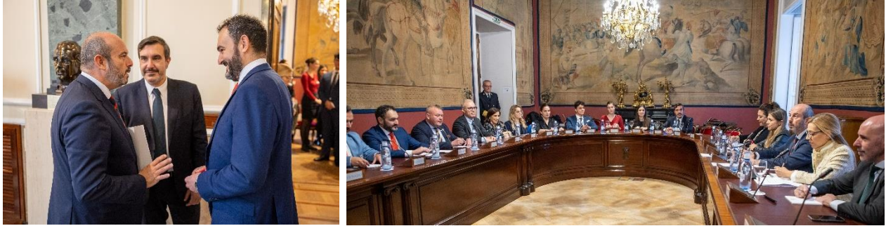
Momentos durante la visita al Senado del Comité de Asuntos Jurídicos de BusinessEurope. (24-25/10/23).