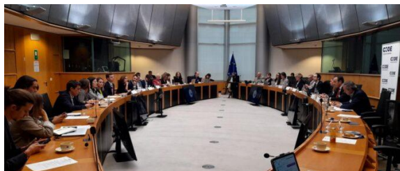
Momento del debate de CEOE sobre el Reglamento de envases, en el Parlamento Europeo en Bruselas (10/10/23).