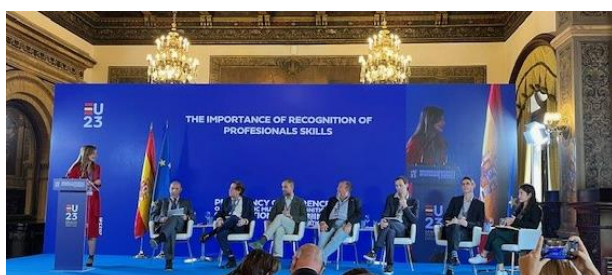
Momento durante la conferencia sobre el reconocimiento de competencias profesionales (23-24/10/23).

El acto reunió en Sevilla a delegaciones de los Estados miembros, organismos y expertos de la Formación Profesional, interlocutores sociales y otras partes interesadas para debatir sobre cómo avanzar en el reconocimiento de competencias profesionales y atraer talento a través del reconocimiento mutuo automático de las mismas.