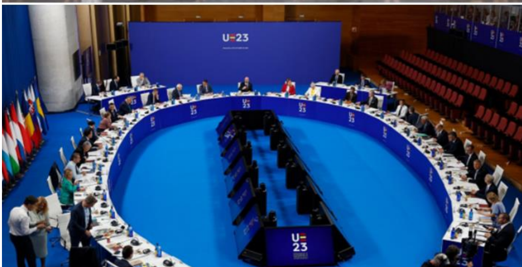
Fotografía de familia en la Alhambra de Granada tras la reunión de la CPE (05/10) y momento de la reunión en el Consejo Europeo Informal (06/10/23).