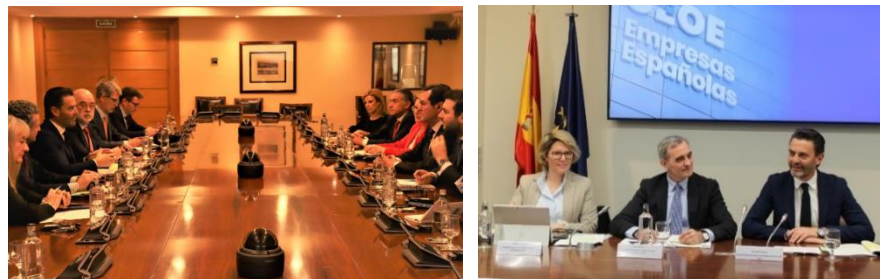
Momentos de la reunión del presidente del Grupo I del CESE con el presidente de CEOE, junto con los miembros de la delegación española del Grupo I, y durante su participación en la Comisión de UE de CEOE (27/02/23).