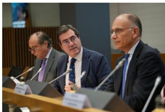
Momentos del diálogo en CEOE con Enrico Letta, encargado de la elaboración del informe de alto nivel sobre el futuro del mercado único europeo (18/12/23).