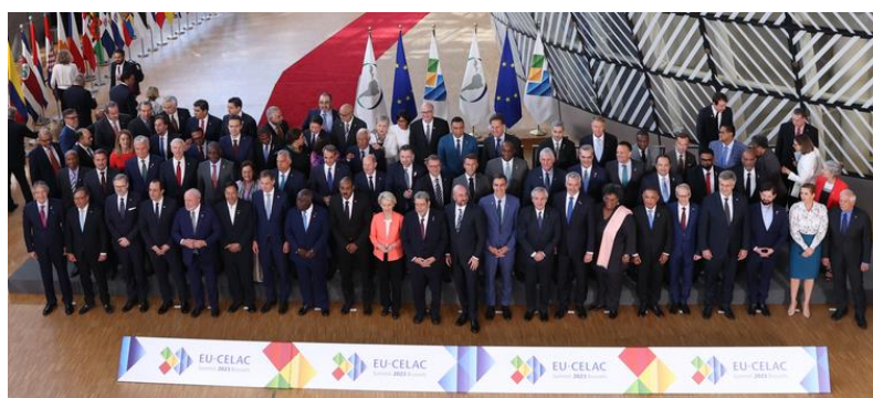
Fotografía de familia de la Cumbre UE-CELAC (17-18/07/23).