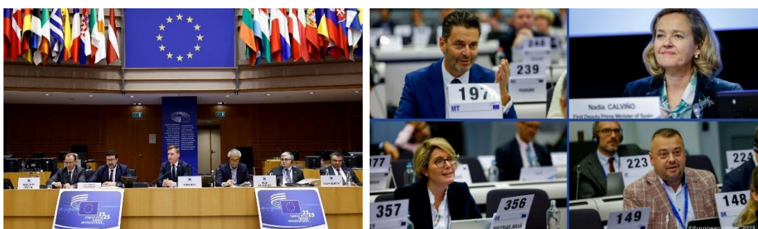
Momento de los debates durante las Sesiones Plenarias de abril (27/04/23) – izqda.- y diciembre (13/12/23) – dcha.

Joaquín Pérez Rey, secretario de Estado de Empleo y Economía Social, intervino en el Pleno del CESE de abril (27-28/04/23) para debatir con los representantes de la sociedad civil organizada sobre los dictámenes exploratorios solicitados por el Ministerio de Trabajo y Economía Social y presentar las prioridades de la Presidencia española del Consejo en materia laboral. Por su parte, Nadia Calviño, en calidad de vicepresidenta primera del Gobierno español, intervino la Sesión Plenaria del CESE de diciembre (13/12/23) para debatir con los representantes de la sociedad civil organizada sobre los resultados de la Presidencia y retos inmediatos a nivel europeo.