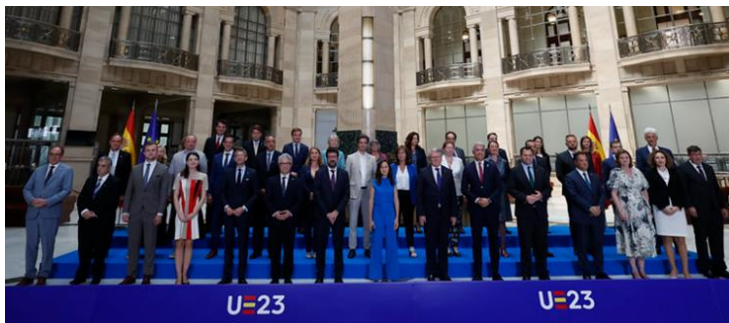
Foto de familia tras la reunión informal ministerial del Consejo EPSCO en Madrid. (13-14/07/23).

Durante la reunión informal de los ministros de empleo y política social de los Estados miembros celebrada en Madrid se abordaron varias propuestas para reforzar el diálogo social en la UE, debatiendo también sobre el trabajo decente y la democracia en el trabajo. Asimismo, se trataron otros temas, como las políticas sociales y de cuidado y la inversión social necesaria para conseguir economías resilientes.