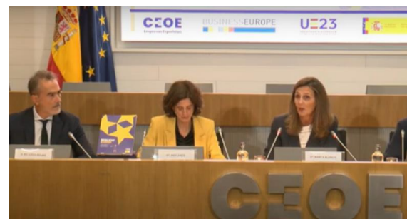
Momentos durante el Foro Resilient EU 2030 con Pedro Sánchez, presidente del gobierno, Antonio Garamendi, presidente de CEOE, Marta Blanco, presidenta de CEOE Internacional y altos representantes empresariales. (15/09/23).