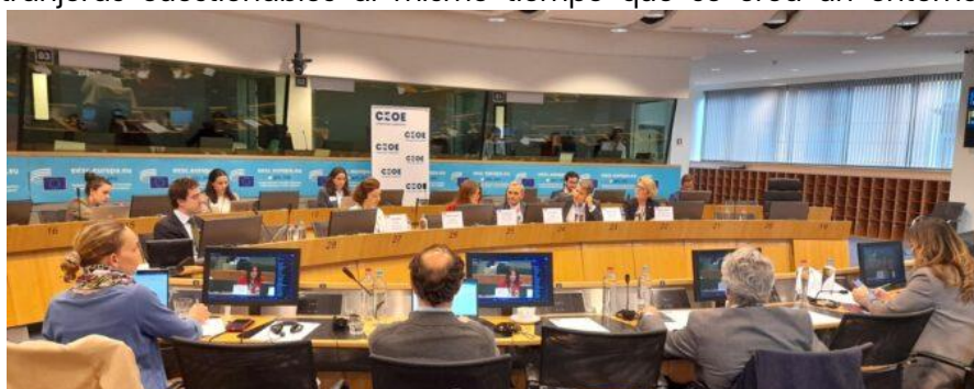
Momentos de la reunión de la Comisión de UE de CEOE celebrada en el CESE (05/07/23).

Los asuntos principales debatidos fueron los retos actuales en el ámbito de la competitividad (incluyendo la sobrerregulación o la falta de avances en la profundización del mercado interior); las prioridades empresariales sobre la Presidencia, haciendo hincapié en la necesidad de un respiro regulatorio así como en cerrar la brecha de competencias; la protección del mercado interior de inversiones extranjeras cuestionables al mismo tiempo que se crea un entorno atractivo y competitivo y la importancia de reflexionar sobre los intereses españoles para el próximo ciclo legislativo europeo y la conformación de la nueva Comisión Europea.