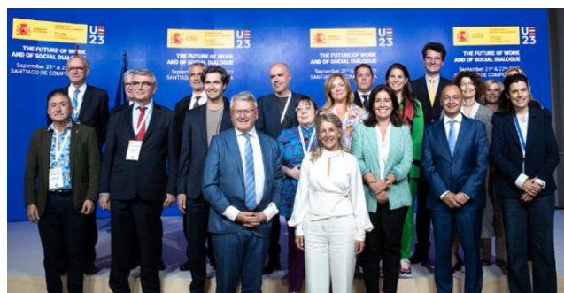
Foto de familia previa a la celebración del acto, incluyendo representantes de BusinessEurope y de CEOE. (21-22/09/23).

El objetivo de la reunión que tuvo lugar en Santiago de Compostela fue debatir entre altos representantes de los Estados miembros y de instituciones europeas, interlocutores sociales y otros expertos sobre el papel del diálogo social en el futuro del trabajo. En este contexto, se abordaron cuestiones como el impacto de la inteligencia artificial y los algoritmos en el trabajo, la negociación colectiva verde o la democracia en el trabajo.