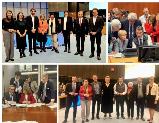
Ejemplos de momentos de reuniones en trílogos: celebración del acuerdo provisional sobre el Reglamento de Libertad de los Medios de Comunicación; revisión del texto final sobre la Ley de Inteligencia Artificial, negociaciones sobre el Reglamento de restauración de la naturaleza o tras lograr el acuerdo provisional sobre el Pacto sobre Migración y Asilo.